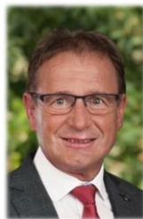
Paul FERCSAK Bürgermeister/načelnik

Naša čuvarnica/jaslice neka bude peldodavna za skupni život jezikov i manjin. Željim vam, dragi roditelji i draga dica, da se dobro ćutite u našem kampusu za obrazovanje i u čuvarnici/jaslice s našimi čuvarničarkami.