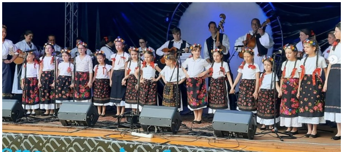
Mladi Hajdenjaki u Mjenovu

Unsere jungen Hajdenjaki haben am Kirtag in Kr. Minihof und beim Schnitzeessen in Unterpullendorf mit ihren tollen Aufführungen einen wunderbaren Beitrag zum Gelingen und Verschönern der Veranstaltungen geleistet.