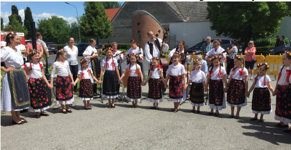
Mladi Hajdenjaki u Dolnjoj Pulji

Unsere jungen Hajdenjaki haben am Kirtag in Kr. Minihof und beim Schnitzeessen in Unterpullendorf mit ihren tollen Aufführungen einen wunderbaren Beitrag zum Gelingen und Verschönern der Veranstaltungen geleistet.